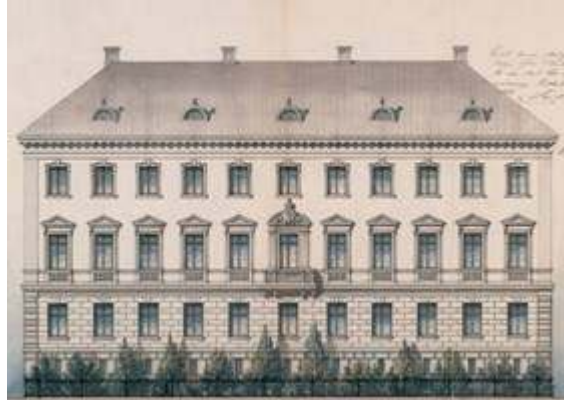
Figur 2 "Pechlinska Palatset" – Ministerhotellet – sett fra Stockholms Strøm. På baksiden (mot Nybroviken) gikk to fløybygninger ut fra bygningskroppen