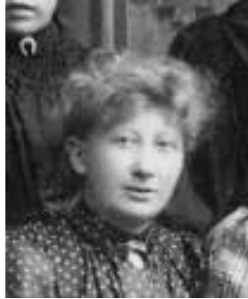
Figur 14 Fra Meråker, like før århundreskiftet, sorg over far, uforsonlig med B.B.