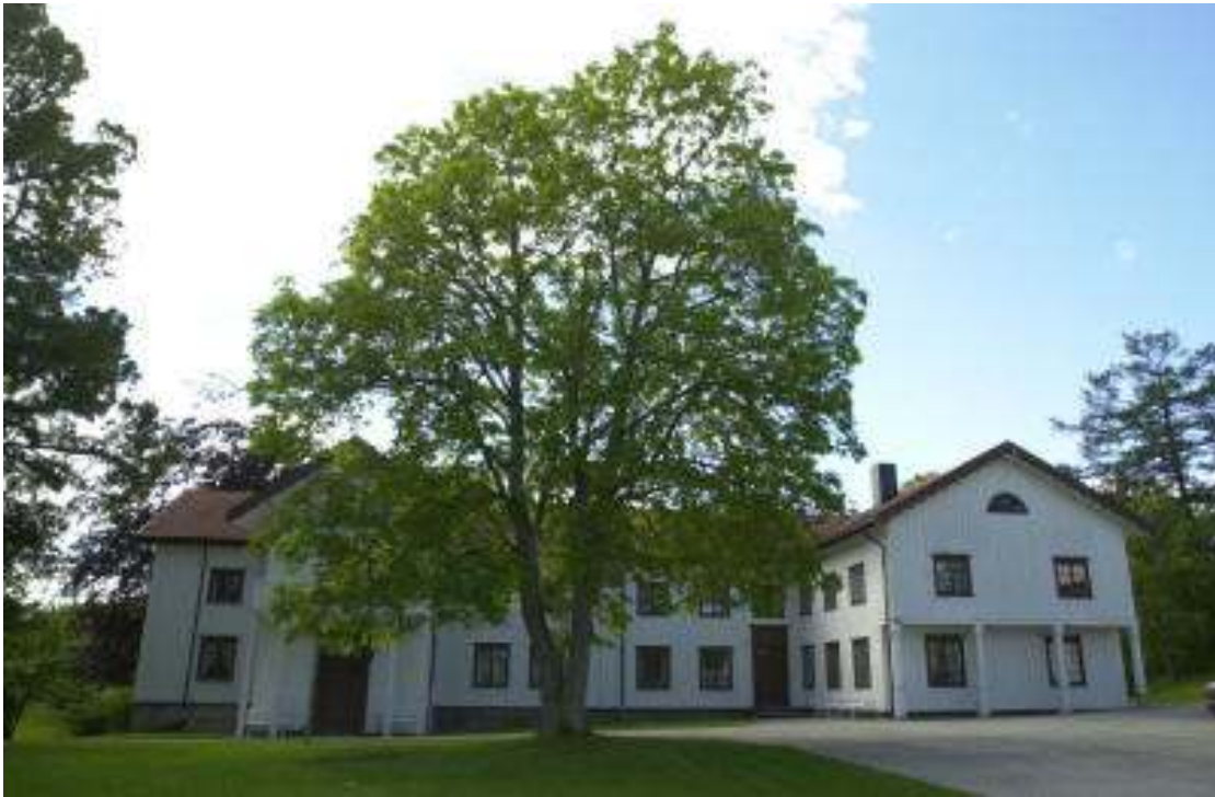
Figur 15 Rostad gård, av Richter sveitseriserte og også forskjønnnet, med dekorativ fransk klassisisme mot veien.

var elev, og erstatter for Ebba Astrup på Rostad 1912-1917, skriver: