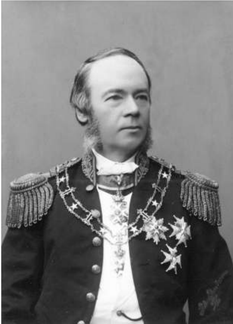
Figur 8 Hans exellence statsministeren.

pengestrød, tretter. Mye alkohol blir det, nervene er på høykant. Hun er irritabel og uberegnelig – det blir mange ubehagelige opptrinn.