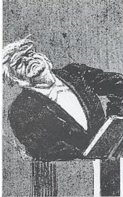
Figur 13 B.B. Kampen om Venstres sjel - og mot Stockholm