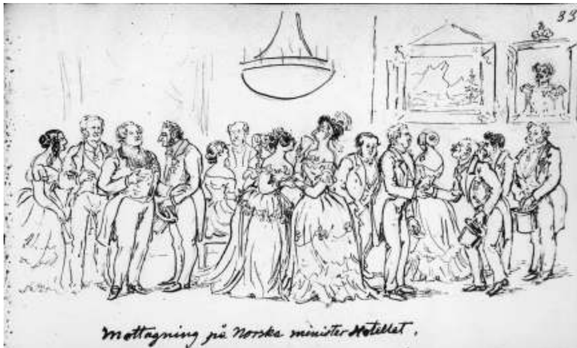
Figur 10 Norsk unionspolitikk og diplomati – og Bernadottenes aristokrati.