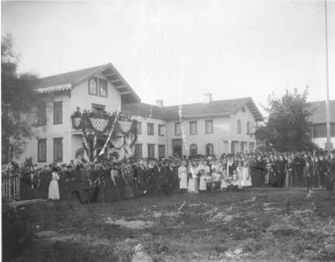
Figur 3 Begravelsen på Rostad - "svart med folk" - folket!