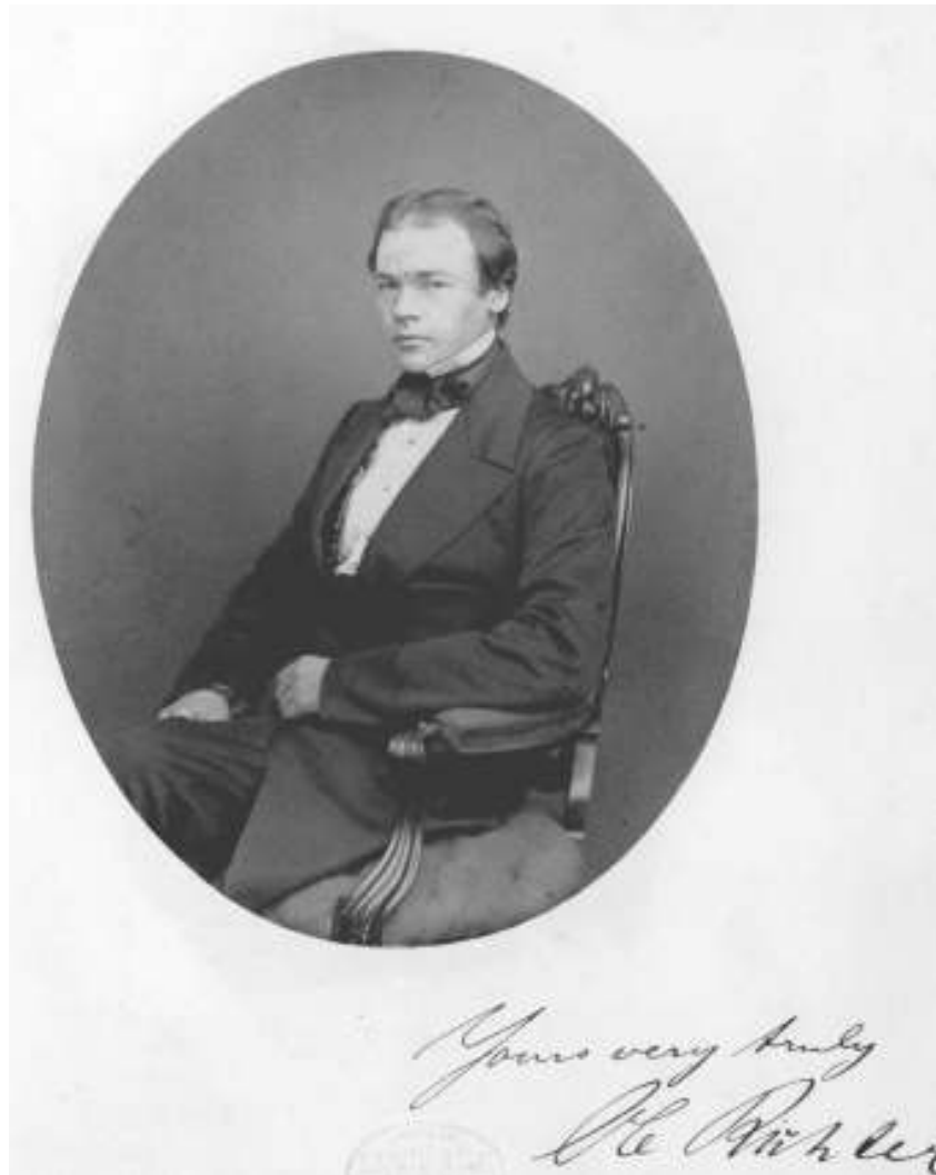
Figur 5 Verdensmann, på vei oppover

Han er jurist og kom i Stortinget i starten av 60-årene. Statsminister ved