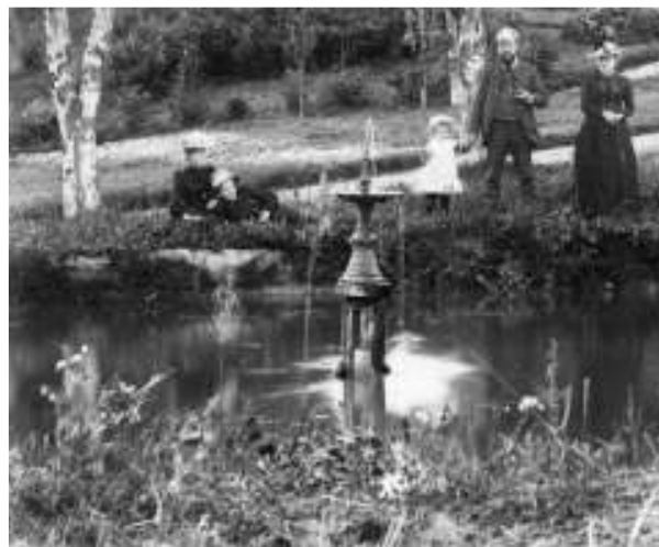
Figur 16 Ny karpedam - bondegård var blitt herregård.