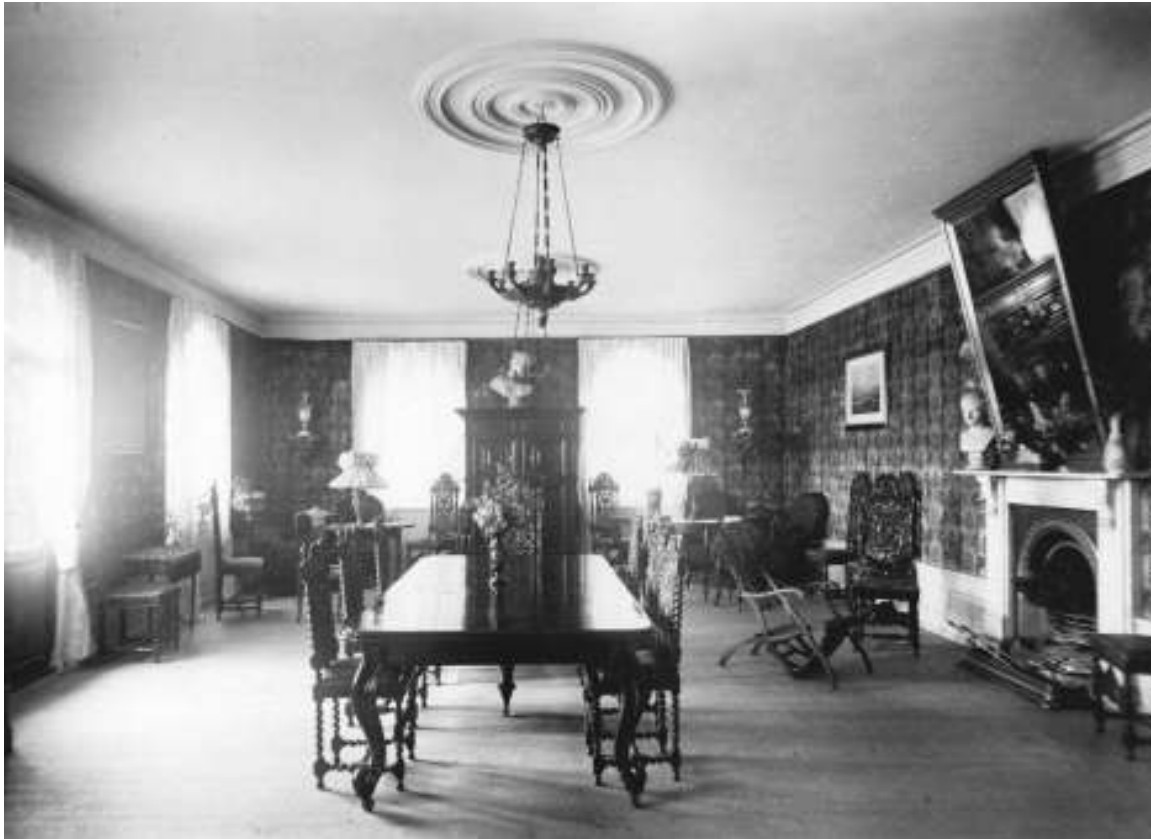
Figur 7 Richters nye festsal på Rostad, fin de siècle - champagne, dans.

Naboene listet seg bort til vinduene for å se Richters fester, det hender endog at de bys på øl ute på plenen.