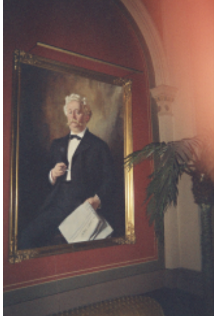
Figur 9 Statsraad Hans Rasmus Astrup: Fra Molde via Kristiansund, Barcelona og Stockholm tilbake til Kristiania

utfordringer med henne, sine forretningshemmeligheter, storpolitiske overveielser, referater fra de innerste politiske gemakker - helt fra hennes unge år og hele tiden fremover. Den som leser brevene i dag og korrigerer for erkjennelsen av hvordan relasjoner mellom barn og foreldre var annerledes for drøye hundre år tilbake må undres - veldig - over åpenheten og nærheten mellom de to.