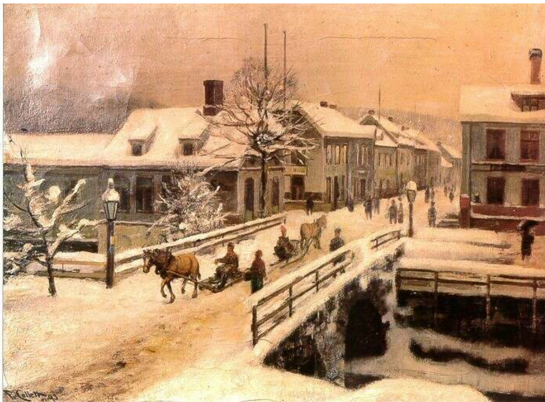
Figur 5 Lillehammer, målad av Fredrik Collett ca 1900. Här är Fröding först möter Bjørnstjerne Bjørnson och Christopher Bruun – Eriksensalen, andra byggnaden till vänster bortom bron.